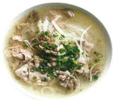
フォー・ボー 1,100 ■牛肉のフォー (税込1,210) Phở bò BEEF PHO