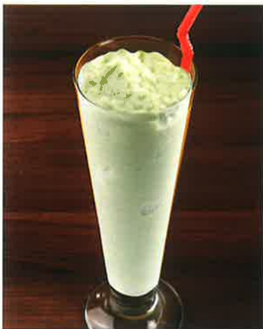
アボカドシントー 700 Sinh tố bơ (税込770) AVOCADO SHAKE