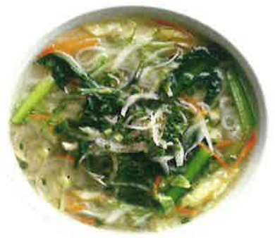
フォー・ラウ 900 ■野菜のフォー (税込990) Phở rau VEGETABLE PHO