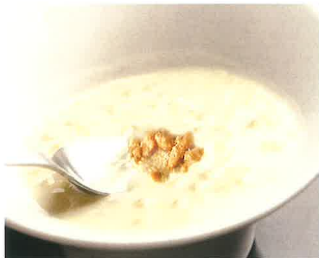
■ベトナム風ぜんざいチャー 555 (税込 610) Chè đậu xanh "CHE" - VIETNAMESE "ZENZAI" ベトナムの伝統的なおやつチャー。 タピオカ、緑豆、ココナッツミルク入り。