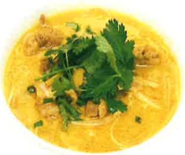
フォー・カリ・ガー ■チキンのカレーフォー Phở cari gà 1,100 CHICKEN CURRY PHO (税込1,210)