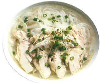
フォー・ガー 900 ■鶏肉のフォー (税込990) Phở gà CHICKEN PHO