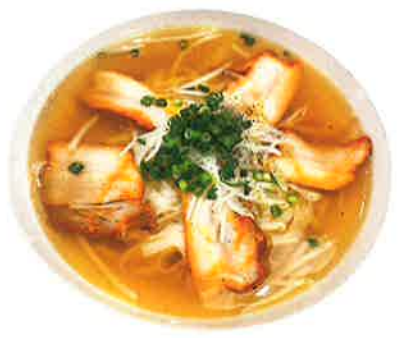
フォー・チャー・シウ ■豚チャーシューのフォー Phở Xá xíu 1,100 VIETNAMESE (税込1,210) CHASHU PORK PHO