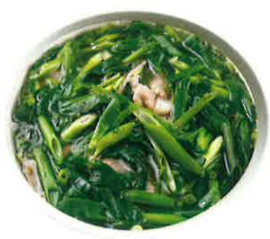
フォー・ボー・ハノイ ■ハノイ風ねぎのフォー (牛肉入り) Phở bò Hanoi 1,200 VIETNAMESE HANOI STYLE BEEF SOUP NOODLE (税込1,320)