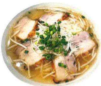
フォー・ヘオ・クアイ ■パリパリ皮の焼き豚のフォー Phở Heo quay 1,200 ROAST PORK PHO (税込1,320)