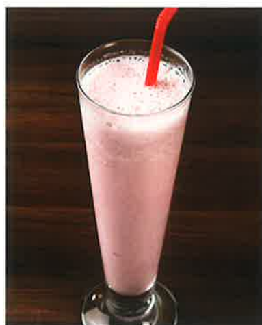
いちごシントー 700 Sinh tố dâu (税込770) STRAWBERRY SHAKE