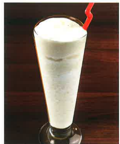
ココナッツシントー 700 Sinh tố dừa (税込770) COCONUT SHAKE